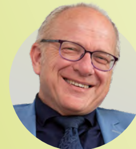
Achim Zerres Abteilungsleiter Energierregulierung Bundesnetzagentur